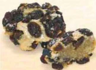
Bocconcino al rum