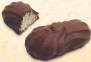
Cocco al cioccolato