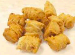
Dorcini Sesamo - Cipolla