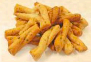
Serpentini vari gusti