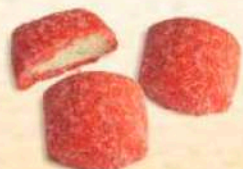
Castagnole al forno al cherry