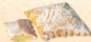
Bugie ripiene al gusto di crema pasticcera e limoncello