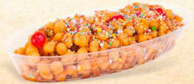
Struffoli con miele