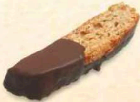
Tozzetti al cioccolato