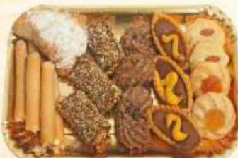
Vassoio misto fantasia Gr. 500 / Gr. 1000