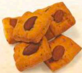
Bocconcini della nonna Pizza