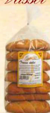
Treccie dolci Gr. 500