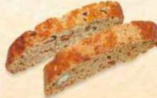
Tozzetti alle mandorle