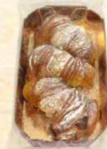
Vassoio codine scure Gr. 180