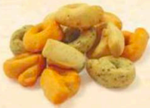
Tarallini tris: Aglio e prezzemolo - Pizza - Olio