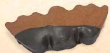
Dipistrello al cioccolato