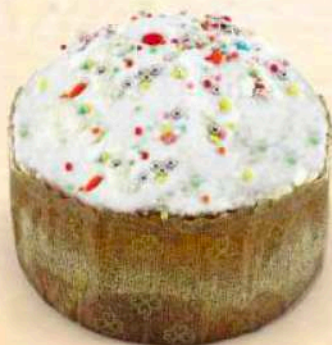
Casatiello dolce Pasquale