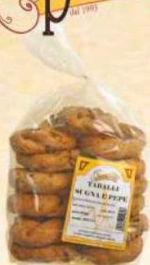
Taralli sugna e pepe Gr. 500