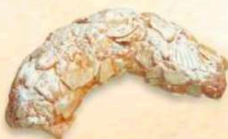
Luna di mandorla