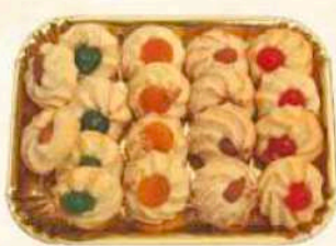
Vassoio mandorla Gr. 500 / Gr. 1000