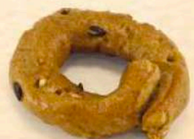
Tarallini ai cereali