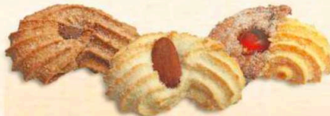
Cuor di Caffè / Mandorla / Colorato