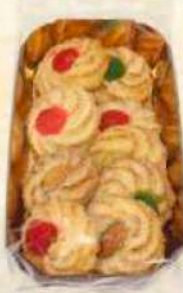
Vassoio dessert Gr. 200