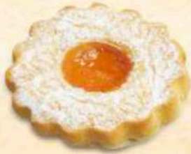
Occhio di bue grande marmellata / cioccolato