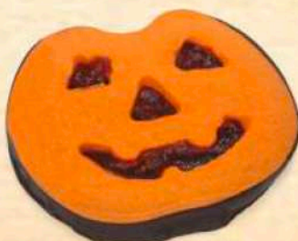
Zucca ripieno alla ciliegia