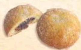
Castagnole ripiene di crema cioccolato al rhum