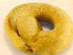
Tarallini al gusto calzone