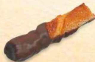
Fiocchetto al cioccolato