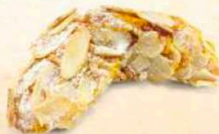
Luna di arancia