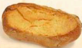
Freselle di mare