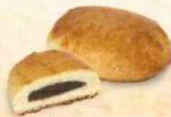
Taralli dolci ripieni vari gusti