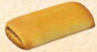
Strudel vari gusti