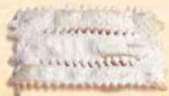
Chiacchiere al forno zucchero a velo