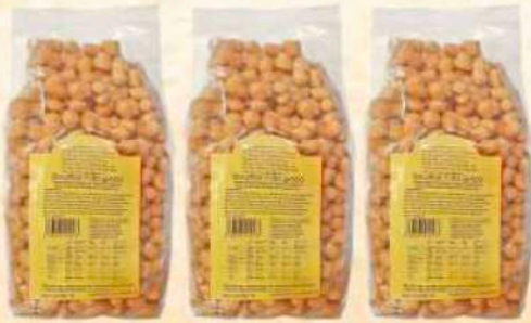
Struffoli senza miele