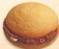
Bacio di Dama nocciola / cacao