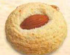
Dessert tondo Mandorla