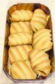
Vassoio intrighi albicocca Gr. 200