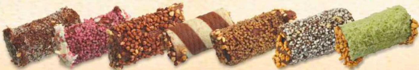
Cannoli ripieni cioccolato