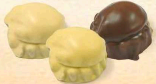
Bacio della nonna vari gusti