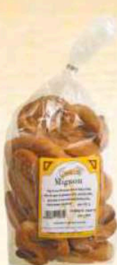
Taralli mignon Gr. 500