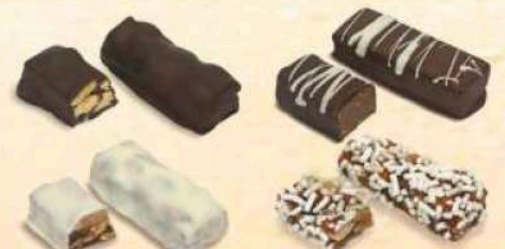
Torroncini vari gusti