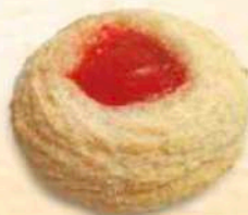
Dessert tondo Ciliegia