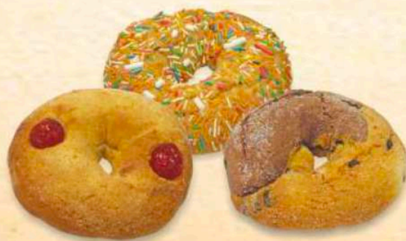
Taralli dolci con ciliegie / con confetti / bigusto