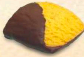
Rombi al cioccolato