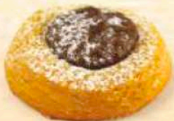
Occhio di bue piccolo cioccolato / marmellata