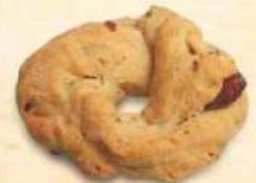
Taralli super mignon