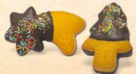
Stella e alberello glassati