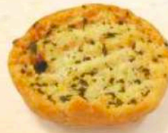
Crostoni vari gusti