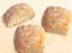
Castagnole al forno al rhum