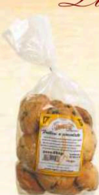
Frollini a cioccolato Gr. 500