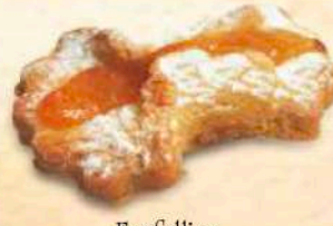
Farfallina marmellata / cioccolato