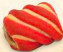
Intrigo frutti di bosco