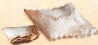
Bugie ripiene al gusto di crema al cioccolato