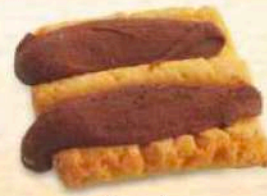
Tegola cioccolato / marmellata