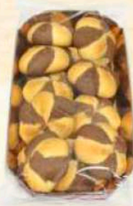
Vassoio ombrellini a cacao Gr. 200