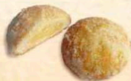
Castagnole ripiene di crema pasticcera