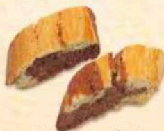
Cantoni tagliati al cioccolato