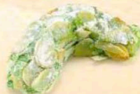
Luna di pistacchio