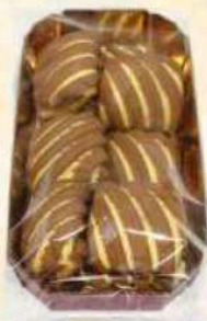
Vassoio intrighi crema cacao Gr. 200