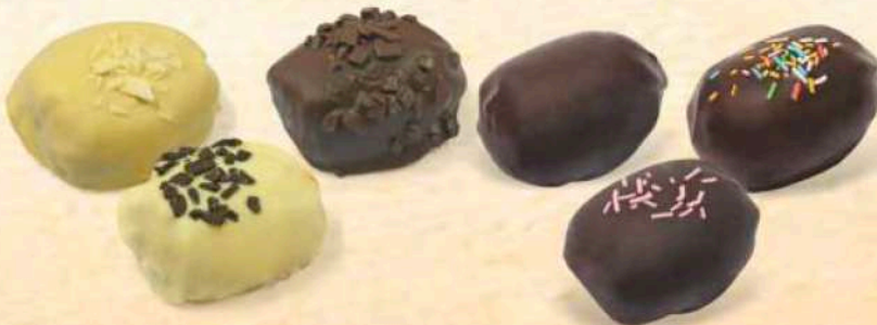
Bombe ripiene vari gusti