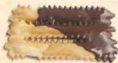
Chiacchiere al forno glassate al cioccolato