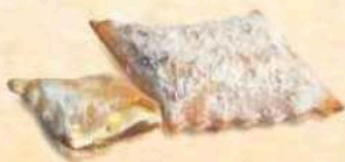
Bugie ripiene al gusto di albicocca e frutti di bosco