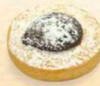
Occhiolino cioccolato / marmellata