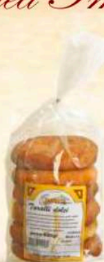
Taralli dolci Gr. 500