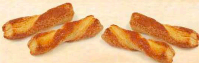
Fiocchetto di pasta sfoglia