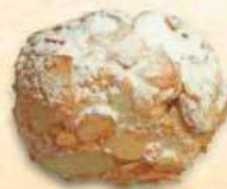
Bocconcino di mandorla