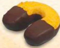
Ferretti al cioccolato