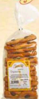
Treccine Gr. 500