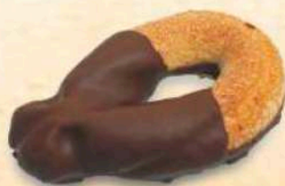
Torcetto al cioccolato