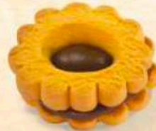
Occhio accoppiato vari gusti