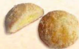
Castagnole ripiene di crema al limoncello