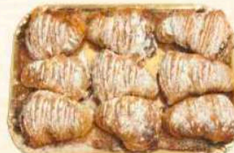
Vassoio codine Gr. 500