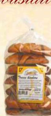
Treccie bicolore Gr. 500