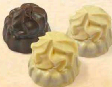
Vesuvio vari gusti