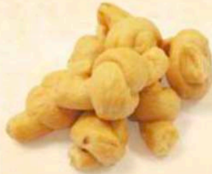
Nodini: Finocchietto Pepe - Sesamo