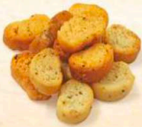
Tostini vari gusti