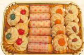
Vassoio misto mandorla e cartucce Gr. 500 / Gr. 1000